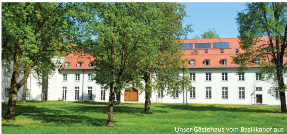
Unser Gästehaus vom Basilikahof aus